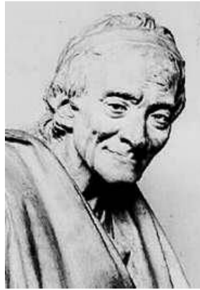
Voltaire a los 80 años de edad.

historia puede referir de las ceremonias de Iniciación y Fúnebre del Gran Voltaire, sólo puede entenderse si se comprende la enorme presencia moral e intelectual que hombres como Helvetius, Diderot, Montesquieu, Rosseau, Cambaceres, Lalande, Franklin, Parry, Lafayette, Washington y otros muchos, tuvieron en la sociedad y en el destino de los pueblos.