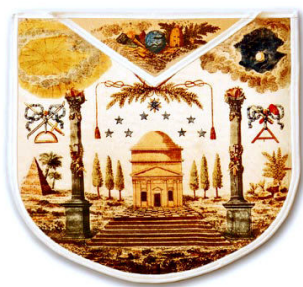
El mandil que había usado Helvetius

fueron recibidos en el pórtico por los hermanos Meslay, Lort, Bignon, Remy, Mercier, Fabrony, Dufresne y después fue introducido por el caballero de Willars. La Logia estaba presidida por Lalande; y el Gran Poeta se apoyaba en los brazos de Franklin y de Court de Gebelin, que le habían ofrecido apoyarle siguiéndoles el caballero de Cubieres. Se suprimieron las pruebas físicas porque todos conocían al filósofo que había expuesto en sus escritos en fondo de su corazón; él había combatido a los enemigos de la humanidad que son, al mismo tiempo, los enemigos de la masonería; él había dado a conocer en sus escritos las mismas doctrinas que la Orden postula. La recepción masónica debe ser el puente que separa la vida de lucha de la vida de calma y para Voltaire, la Iniciación era el coronamiento. Las pruebas a las que se le sometió le permitieron al Poeta exponer sus ideas. Uno de los hermanos que asistieron a la ceremonia expresó: “Es para nosotros la lección, no para él”. Cuando llegó el momento de entregarle las insignias, Lalande le dio el Mandil, símbolo del Trabajo: era el mandil que había usado Helvetius, y VOLTAIRE al estrecharlo entre sus manos lo llevó espontáneamente a sus labios honrando con esta demostración a uno de los más sabios y enérgicos masones de aquella época.