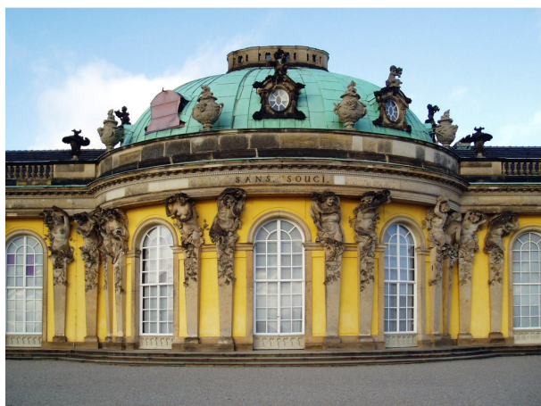
Palacio de Sanssouci.

Durante aquella época escribió El siglo de Luis XIV (1751) y continuó, con Micromegas (1752), la serie de sus cuentos iniciada con Zadig (1748). Debido a algunas disputas con Federico II se le expulsó nuevamente de Alemania y, debido a la negativa de Francia de aceptar su residencia, Voltaire se refugió en Ginebra, Suiza, lugar en el que chocó con la mentalidad calvinista 14 . Su afición al teatro y el capítulo dedicado a Miguel Servet 15 en su Ensayo sobre las costumbres (1756) escandalizaron a los ginebrinos.