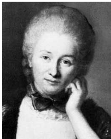
Émilie du Châtelet.

En esta misma época, tras el éxito de su tragedia Zaire (1734) escribió Adélaïde du Guesclin (1734), La muerte de César (1735), Alzira o los americanos (1736), Mahoma o el fanatismo (1741). También escribió El hijo pródigo (1736) y Nanine o el prejuicio vencido (1749), que tuvieron menos éxito que los anteriores.