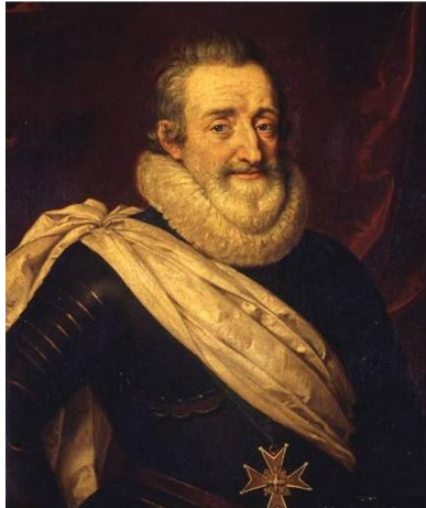
Enrique IV de Francia.

En 1718 su tragedia Edipo y en 1723 su epopeya, La Henriade , dedicada al rey Enrique IV 8 , tuvieron un gran éxito.