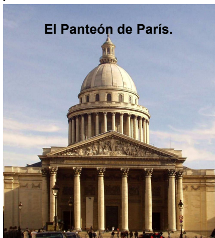
El Panteón de París.

En 1778 Voltaire volvió a París, se le acogió con entusiasmo y murió el 30 de mayo de ese mismo año, a la edad de 84 años. En 1791, sus restos fueron trasladados al Panteón 18 .